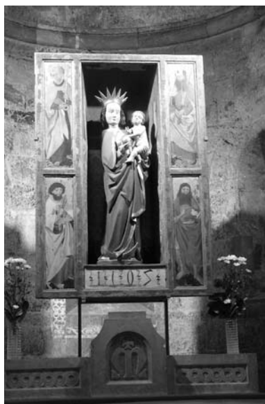
A csemeszkopácsi meglepetés