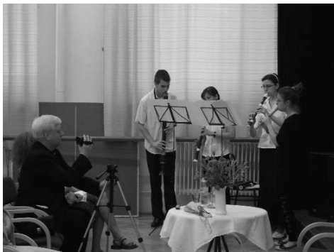
Készül a dokumentáció