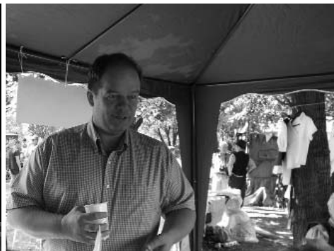
Vendég a háznál