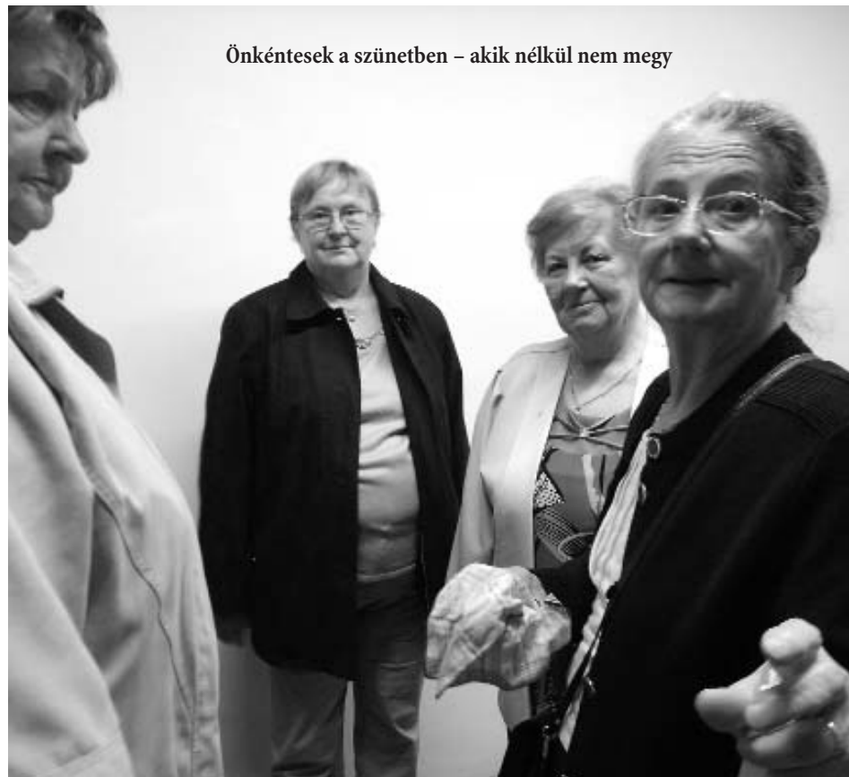
Önkéntesek a szünetben – akik nélkül nem megy