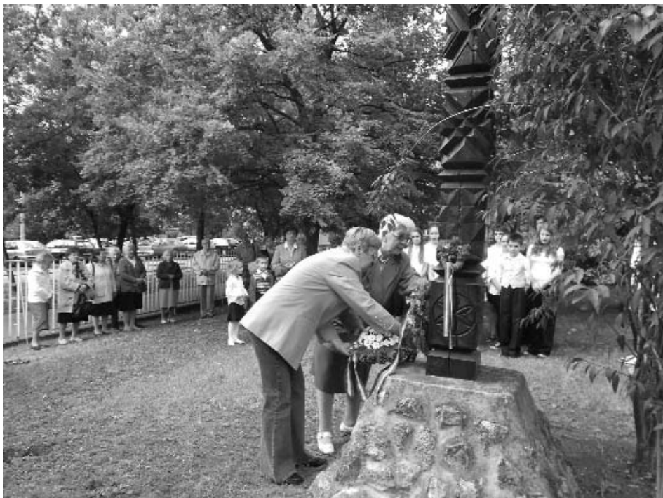
Koszorúzás Szent Gellért kopjafájánál