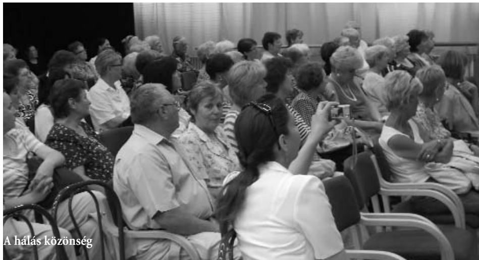
A hálás közönség